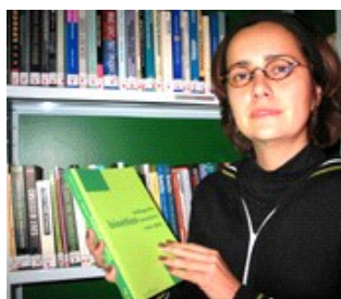
"Das mulheres que acompanhei, apenas uma não quis abortar"