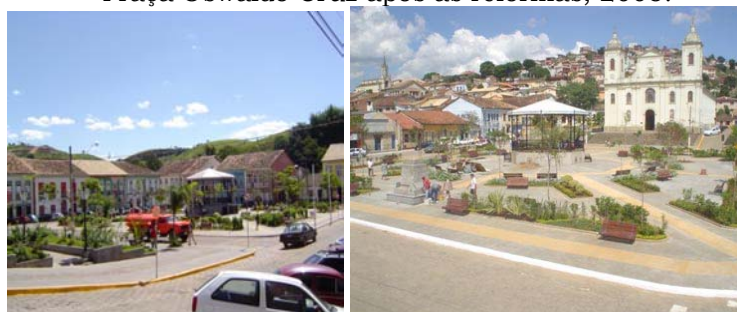
Praça Oswaldo Cruz após as reformas, 2005.