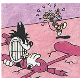
Squeak the mouse