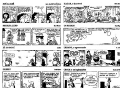
Figura 6: Sección de historieta del periódico O Globo .

La Editora Via Lettera, propiedad de un conocido y muy respetado traductor de historietas, con más de veinte años de experiencia en el trabajo editorial del género, cuenta en su catálogo con las obras de algunos de los más importantes historietistas de la actualidad, como los títulos «Do Inferno» («From Hell», de Alan Moore y Ed. Campbell), «V de Vingança» («V of Vendetta», de Alan Moore y David Lloyd), «Estranhos no Paraíso» («Strangers in Paradise», de Terry Moore), «Bone» (de Jeff Smith.) y «As Aventuras de Luther Arkwright» (de Brian Talbot). En los últimos años la Editora Via Lettera viene también publicando libros de historietas producidos en Brasil, ampliando su actuación en el mercado. Hasta el momento, ha publicado