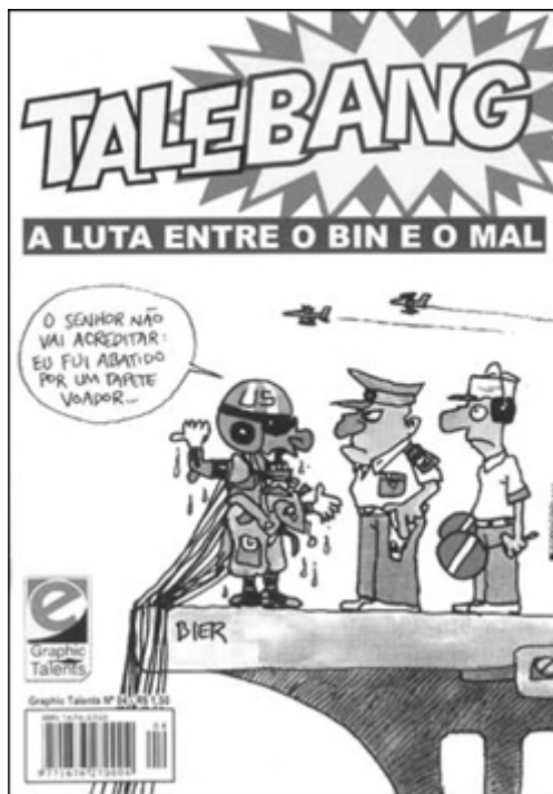
Figuras 1 y 2: Portadas de dos revistas de la serie Graphic Talents de la Editora Opera Graphica.

Las revistas de historietas se difundieron masivamente en Brasil en la década del cuarenta del pasado siglo, cuando las casas editoriales Editora Brasil América Ltda. (EBAL) y Rio Grafica y Editora (RGE) pasaron a publicar revistas en formato comic book , normalmente con 33 páginas, incluidas las portadas. El contenido de las revistas era en general de procedencia norteamericana, con el predominio de los superhéroes como Superman, Batman, Captain Marvel y otros. Con la entrada de la Editorial Abril en el mercado brasileño, los personajes Disney también hicieron su debut en el país, donde permanecen hasta hoy.