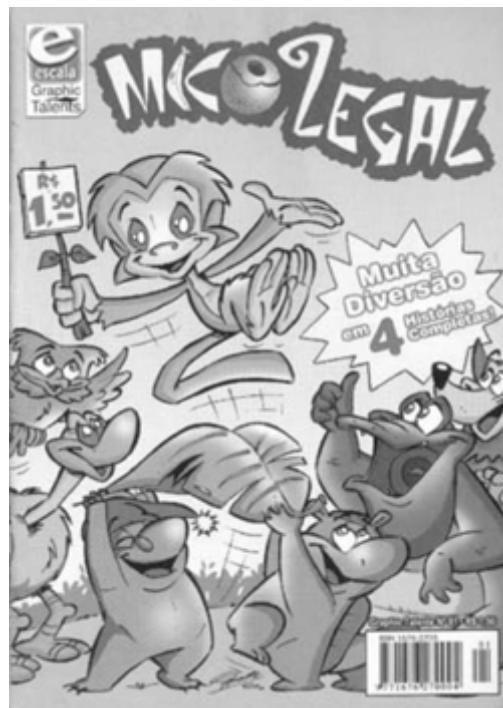
Figura 5: Portada de una revista de la serie Graphic Talents de la Editora Opera Graphica.

Como ha ocurrido en prácticamente todos los países, también en Brasil la historieta ha perdido espacio en los periódicos, espacio que ha sido reducido en general a poco más de un cuarto de página, cuando no suprimido totalmente. Dificultades de mantenimiento de la periodicidad de producción de una tira diaria también alejan a los historietistas de este tipo de afán artístico. Son pocos, relativamente, los dibujantes brasileños que mantienen una tira diaria en periódicos del país, y se concentran en pocos periódicos. Los principales diarios del país, concentrados en las capitales, presentan un total de 42 tiras (ver tabla 3 y tabla 4). De este total, 42.8% son producidas en Brasil y el resto en otros países, básicamente Estados Unidos (la única excepción identificada es la tira de Reg Smythe, «Zé do Boné» («Andy Capp», originalmente inglesa). Aparte de esto, se nota también la presencia del mismo personaje en varios periódicos diferentes, como «Hagar», o «Horível» («Hagar, the Horrible», de Dik Browne) y «Recruta Zero» («Beetle Bailey», de Mort Walker). En general, las tiras extranjeras son de personajes bastante conocidos, con varias décadas de publicación.