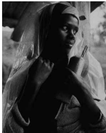
Figura 8 (1991)