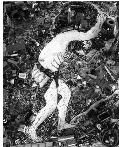
Figura 15 (2008)

O regime da réplica trabalhado por Vik Muniz desdobra-se inúmeras vezes. Paulo Herkenhoff distingue um tríplice regime. O primeiro é o uso da fotografia como réplica do mundo, quando há apropriação de obra autoral de outros fotógrafos ou artistas. O segundo processo revela-se em esculturas, pinturas e desenhos produzidos por Vik como réplica da fotografia, com auxílio de mate-