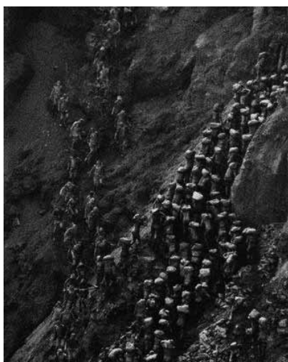
Figura 4 (1986)