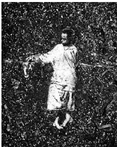
Figura 1 (1998)

te de grandes dimensões. Por exemplo, a série “O Depois”, criada em 1998 para a Bienal de São Paulo, apresenta imagens de crianças de rua de São Paulo. Vik Muniz mostrou-lhes um livro de arte e pediu que cada uma escolhesse uma pose para imitar. Vik fez as fotos e usou-as como base para as imagens feitas com lixo colorido jogado às ruas no Carnaval. A imagem resultante – Sócrates (fig. 1) – tem 183 x 122 cm. A foto de Sebastião Salgado (fig. 2) também nos remete a uma infância triste em meio a fragmentos de resíduos.