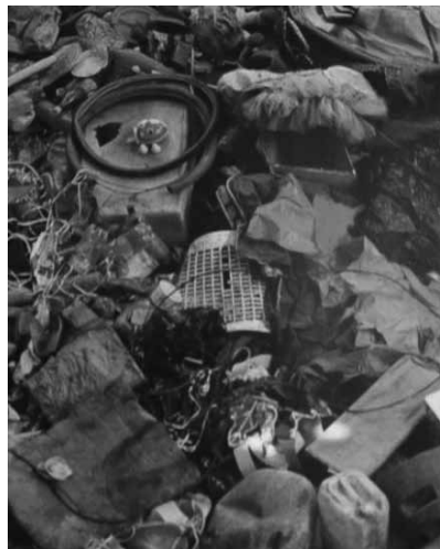
Figura 5 (2008)