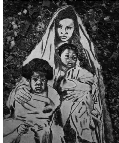
Figura 7 (2008)

Além dos estereótipos iconográficos presentes nas fotos dos dois autores, talvez não haja, em relação à obra de Vik Muniz, a diferença de olhar apontada por Susan Sontag. Há um projeto de notação sim, mas é importante registrar que na feitura da imagem da Madona do Lixo houve uma escolha feita pela própria personagem, entre diversas fotos clicadas pelo artista plástico. Nesse sentido, há uma espécie de protagonismo na pessoa retratada. Podemos observar ainda processos metafóricos nas duas imagens. Margarita Ledo (1998:130) se refere à metáfora como um modo de falar de uma coisa para entender outra; na metáfora se destacam certas