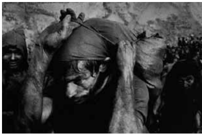
Figura 13 (1986)