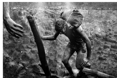
Figura 16 (1986)