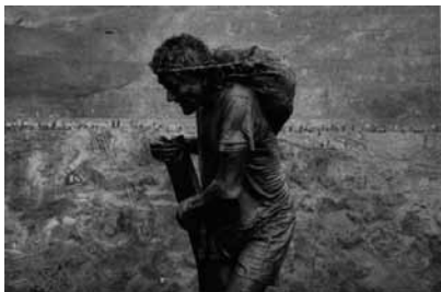
Figura 14 (1986)

sem, no entanto, descuidar da perspectiva documental. Voltemos a Susan Sontag, que considera que “a câmera define para nós o que permitimos que seja ‘real’ – e empurra continuamente para adiante as fronteiras do real.” E, por isso: