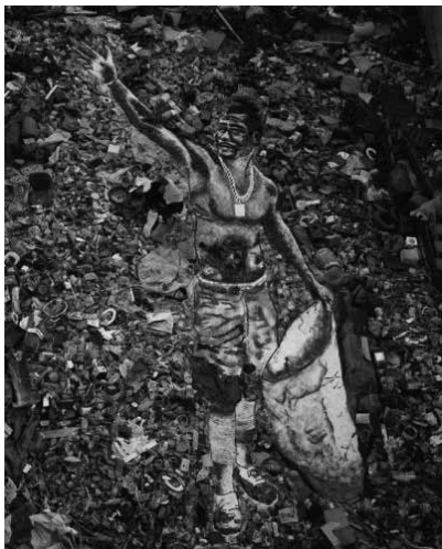
Figura 3 (2008)