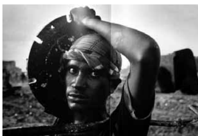
Figura 18 (1980)

duas fotos são espelhadas entre si, mas não são espelho do mundo. Não são puramente reprodutivas, nem puramente documentais. Usam da reprodução, mas não tendem à reprodução. Não são cópias, são representações e re-representações; transpuseram o conceito de objeto natural.