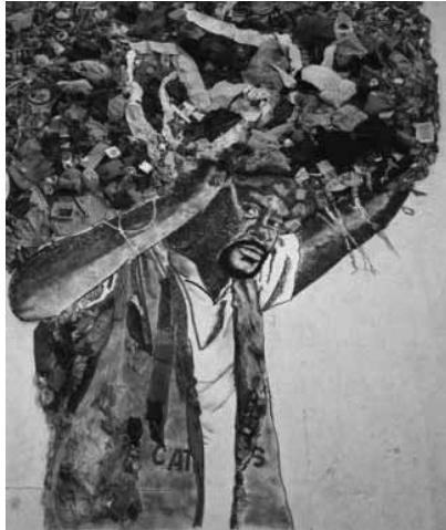
Figura 12 (2008)