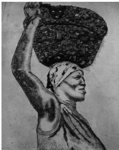
Figura 17 (2008)

Consciência ótica, consciência metalingüística de desconstrução da imagem que é observada: Salgado e Muniz não trabalham com imagens transparentes. As formas das