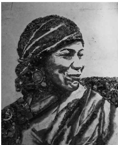
Figura 10 (2008)

Cincuenta años después, en los noventa, en la prensa y en los nuevos espacios institucionalizados – lejos de lo alternativo, de la contracultura o de lo underground –, la foto utiliza lo documental como voyeurisme o como lo purely visual. Mientras, y porque también se extiende un modo absolutista y totalitario de Poder, los fotógrafos vuelven a la experiencia, los teóricos materialistas se van metiendo en la explicación del cotidiano, reaparece el contexto social como determinante (...) (Ledo, 1998:130).