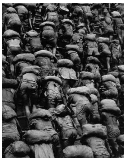
Figura 6 (1986)

organizou as “Imagens do Lixo” no interior de um grande galpão; ele não usa nenhum programa tipo Photoshop para tratar as imagens); foi preservado o tamanho “natural” de cada objeto. Olhando de longe, não percebemos que a imagem é formada por tantos detalhes; chegando mais perto, identificamos cada pequena parte. Em Salgado e em Muniz, a foto nasce como documento, como registro, mas ambas se dispõem a intervir, inclusive com ruídos, no curso dos acontecimentos. Margarita Ledo (1998:22), estudiosa da foto documental, mostra como esta se desdobra em símbolo, e mantendo ainda sua iconicidade, sua semelhança com o referente, e sua indicialidade – o rastro desse referente. Salgado parte da composição