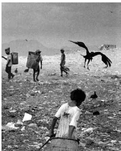
Figura 2 (1983)

Há uma intenção documental nas duas imagens, embora a foto de Vik Muniz implique em sobreposições. Salgado opera com a