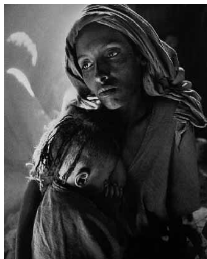
Figura 9 (1984)