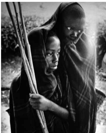
Figura 11 (1991)

Fotografias documentais costumam apontar para o outro, o desconhecido, o diferente – e nisso se inclui a denúncia, a exclusão, a injustiça –; credibilidade é uma característica quase sempre decorrente. A mulher do lixo e as duas crianças trazem esse rasgo indicial: os panos na cabeça remetem a culturas africanas. Margarita Ledo (1998:131-132) considera o documentalismo uma das linhas mestras da foto de atualidade, no duplo sentido griersoniano: o real e o que está a ponto de acontecer. Assim, entre as fotos documentais, “podemos escoger ejemplos y contra-ejemplos que rompen con la cultura fotográfica tradicional y con el papel que se le asigna a la foto de referente real en los media (...)”. Apesar de conservarem algo da cultura fotográfica tradicional, as duas imagens trazem camadas adicionais de significação: a cumplicidade estabelecida entre o fotógrafo como autor e as pessoas fotografadas (que, no caso de Vik Muniz, participaram da escolha da “pose” a ser transformada em obra de arte) encaminha para uma aura metafórica. Vik Muniz retoma códigos da cultura midiática, reciclando-os e fabricando