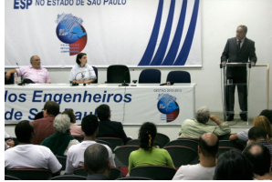
O encontro decidiu pela ampliação do movimento em prol da TV pública do estado de São Paulo

São Paulo - Jornalistas, sociólogos, coletivos em prol da liberdade de expressão e ex-funcionários reuniram-se ontem (3), na sede do Sindicato dos Engenheiros do Estado, no centro da capital, para debater as causas do sucateamento da TV Cultura. O encontro decidiu pela ampliação do movimento em prol da TV pública do estado de São Paulo. O objetivo principal, segundo os participantes, é a reversão do quadro de sucateamento técnico e de conteúdo, agravado na atual gestão de João José Sayad, para uma programação plural e diversificada, mantendo a essência de uma televisão sem fins comerciais.