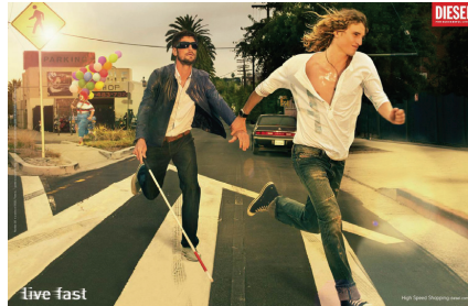
Figuras de 1 a 6 – Campanha publicitária Diesel “Live Fast”.

A marca de moda Diesel tem origem na Itália, no ano de 1978. Atualmente está presente em mais de 80 países e 10.000 pontos de venda. Segundo seu presidente Renzo Rosso a missão Diesel é “Começando como uma companhia focada em produzir roupa de qualidade, Diesel já se tornou parte da cultura jovem mundial. Ela pode se intitular, de forma legítima, a primeira marca a acreditar verdadeiramente na aldeia global e a recebê-la de braços abertos” 5 .