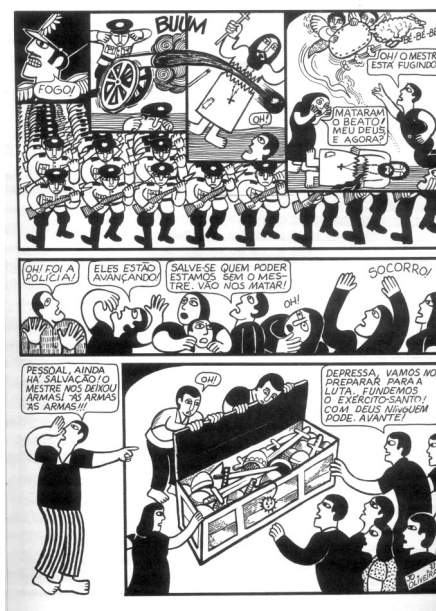
Figura 2: A história A guerra do reino Divino mistura quadrinhos e literatura de cordel

apresenta o desespero das pessoas com o avanço da polícia e, na parte de baixo, são usadas duas vinhetas, sendo que uma delas está sem o requadro (fio que contorna o quadrinho). Do ponto de vista temático, é possível relacionar o conteúdo à repressão sofrida pelos habitantes de Canudos e à religiosidade popular do Nordeste. Já no que concerne à estética, o estilo gráfico do autor assemelha-se aos desenhos da literatura de cordel, típica da cultura nordestina.