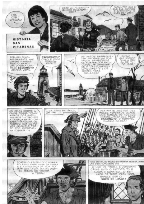
Figura 1: Página de quadrinhos desenhada nos anos 1970 por Rodolfo Zalla para livro de Ciências

Com o tempo, contudo, os conflitos entre histórias em quadrinhos e educação foram se amenizando. A partir dos anos 1970, já era possível encontrar narrativas gráficas sequenciais em livros didáticos brasileiros, elaboradas por artistas consagrados, como Eugenio Colonnezze ou Rodolfo Zalla (1992). Esses quadrinhos sintetizavam ou exemplificavam, em uma ou mais vinhetas, o conteúdo do tópico ou do capítulo. Utilizando a linguagem característica dos quadrinhos (balões de fala, recordatórios etc.), estes eram usados para suavizar a diagramação e complementar de forma mais leve o texto didático.