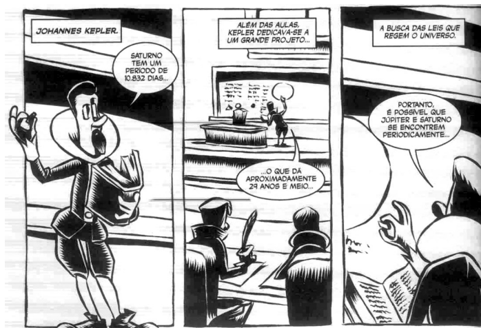
Figura 7: História apresenta a evolução da Física

dos professores Annibal Hetem Junior e Jane Gregorio-Hetem e o desenhista Marlon Tenório.