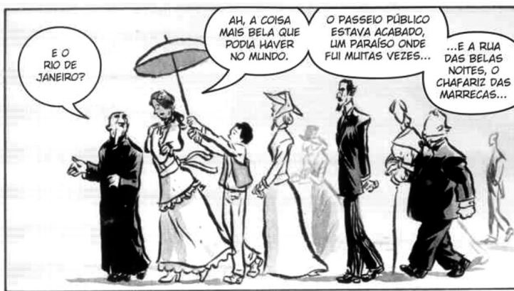
Figura 3: A adaptação de O Alienista mostra o vestuário e os costumes do século XIX

A história em quadrinhos, por seu caráter icônico, acrescenta informações visuais ao elemento verbal. Em O alienista , de Machado de Assis, versão realizada pelos artistas Fabio Moon e Gabriel Bá (2007), além da história originalmente concebida pelo Bruxo do Cosme Velho , o leitor também encontra dados sobre o comportamento social no final do século XIX. Na Figura 3, por exemplo, vê-se um garoto negro acompanhando a senhora branca e segurando seu guarda-chuva, o que evidencia a divisão racial existente na época.