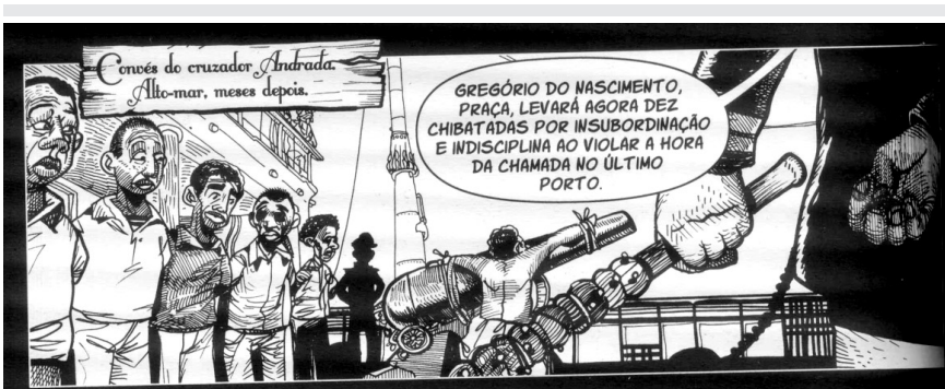
Figura 6: Quadrinhos reconstituem a Revolta da Chibata