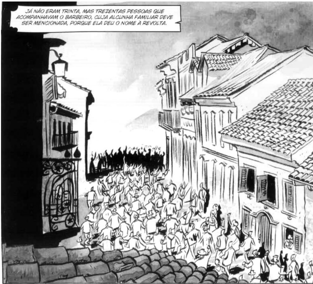
Figura 4: Elementos arquitetônicos do século XIX são cenários da história em quadrinhos

Por meio de sua iconicidade, a história em quadrinhos pode oferecer ao leitor elementos que o texto literário apenas descreve ou não apresenta: na mesma adaptação, podem ser vistos o vestuário (Figura 3), o mobiliário, a decoração das casas e o estilo arquitetônico daquele período (Figura 4). Cabe ao professor ressaltar esses aspectos presentes em narrativas quadrinhísticas, para que a leitura extrapole os limites do aspecto verbal e seja enriquecida pelo visual.