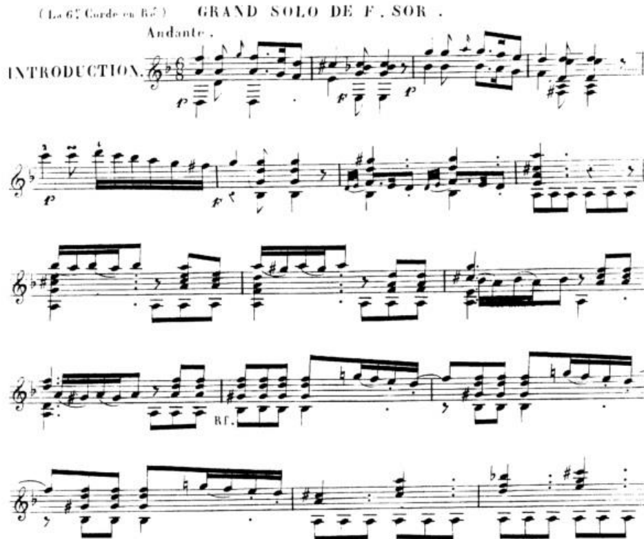
Ex.11: Introdução do Op.14 . Contraste de dinâmica, fraseado e textura; possível alternância entre solo e tutti nos seis primeiros compassos.

No que se refere à comparação com a escrita sinfônica, pode-se encontrar em suas peças a representação do contraste entre solo e tutti , os crescendi orquestrais e a divisão de planos sonoros, além dos já explicitados: o contraste timbrístico e a representação de instrumentos (Ex.11) 14 .