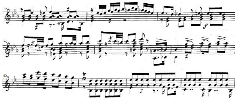
Ex.9: Trecho do Andante Largo da Sonata, Op. 25 . As terças dos c.41-42 representariam o oboé.

Como já descrito acima, Sor preocupava-se com uma escrita que fosse capaz de imitar instrumentos de orquestra. O exemplo abaixo elucidava o que já foi descrito neste trabalho (Ex.9) 12 .