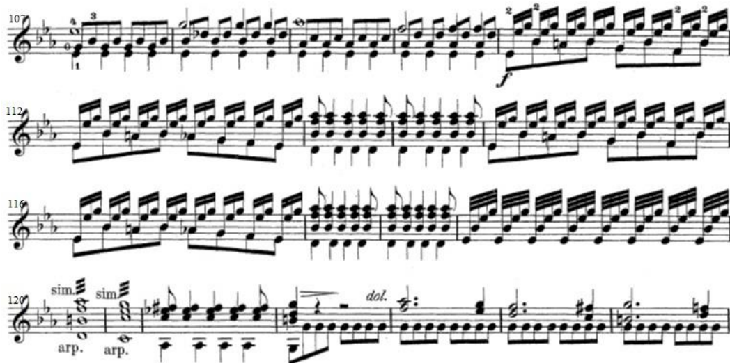
Ex.5: Trecho do Allegro da Sonata , Op.22. Contrastes entre os arpejos e os acordes em forte e, posteriormente, início de uma parte dolce .

Como já mencionado, Sor toma contato com as óperas, como as de Cimarosa, sendo assim, é possível encontrar várias das características de ópera, como os contrastes timbrísticos, de fraseado e de dinâmica, além de pausas dramáticas (Ex.5-6) 9 .