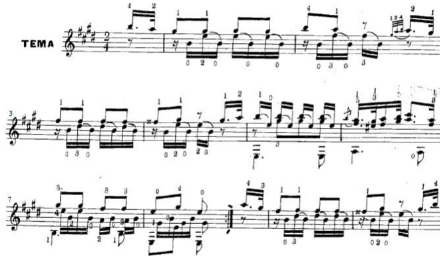
Ex.7: Início do Op.9 . Acompanhamento com notas ligadas.

Utiliza diversas formas possíveis da guitarra para fazer uma melodia acompanhada, entre elas, o baixo de Alberti (Ex.7) 10 .