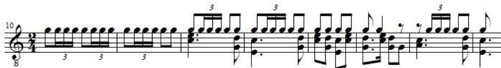
Ex.1: Trecho do Estudo, Op.35 n.19 . É construído inteiramente com o mesmo padrão, aludindo à imitação de um instrumento de metal.

Sor utiliza colcheia ou semicolcheia pontuada para a representação da marcha (Ex.1). Essa escrita também confere movimento para quando não se é possível sustentar as notas da melodia, além de amplificar o som 5 .