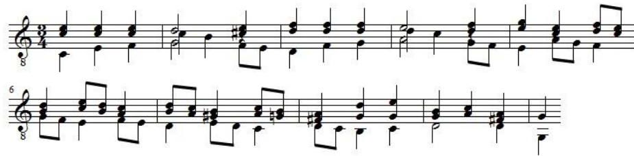
Ex.3: Trecho do Estudo , Op.6 n.8 (c.1-10). Tratamento polifônico.

Haydn se utilizassem ainda desta técnica. Também podemos encontrar a escrita dos rasgueados e punteados (Ex.3-4) 8 .