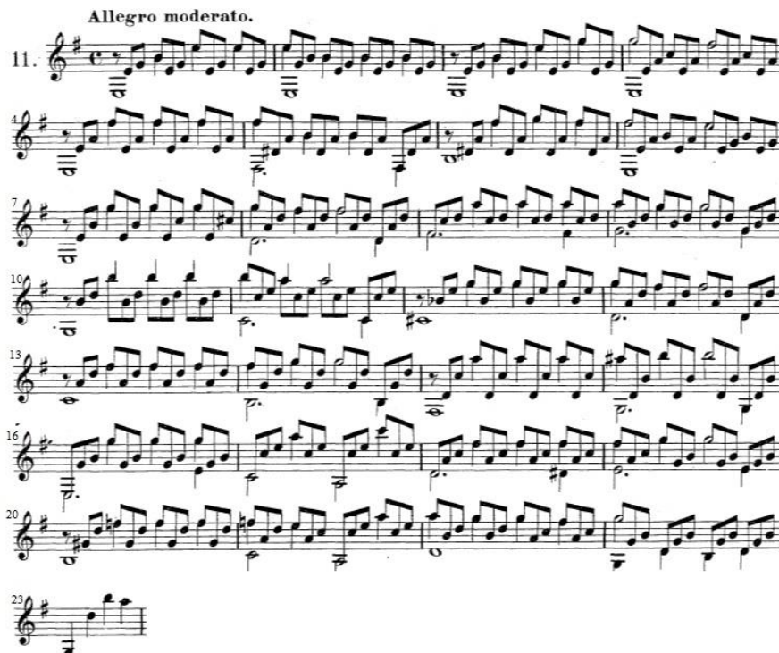
Ex.8: Primeira seção do Estudo, Op.6 n.11 . Percebe-se uma semelhança com os improvisos de Schubert. Mesmo se tratando de uma melodia acompanhada, vê-se a preocupação com os encadeamentos das vozes internas, como nos c.8-9.

É possível encontrar a influência de Schubert ou Beethoven em algumas de suas obras, encontrando semelhança com os improvisos escritos para piano do séc. XIX (Ex.8) 11 .