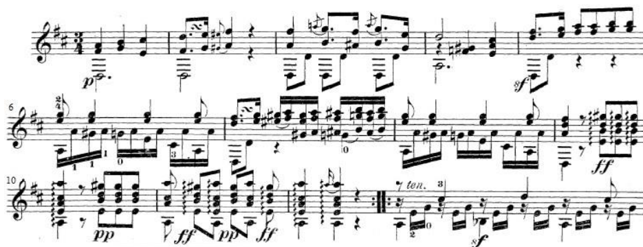
Ex.10: Início do Minueto, Op.11 n.4 . Construção de frase e ornamentos utilizados.

A construção de frases do compositor se assemelha ao estilo clássico em que se leva em consideração o equilíbrio e a harmonia completamente implícita na melodia (Ex.10). Por último, em muitas de suas peças encontram-se ornamentos que se assemelham aos utilizados por Haydn em seus quartetos, por exemplo 13 .