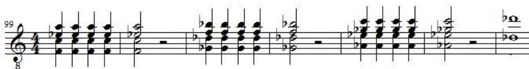
Ex.6: Trecho do Allegro do Op.14 (início do desenvolvimento). Pausas dramáticas.