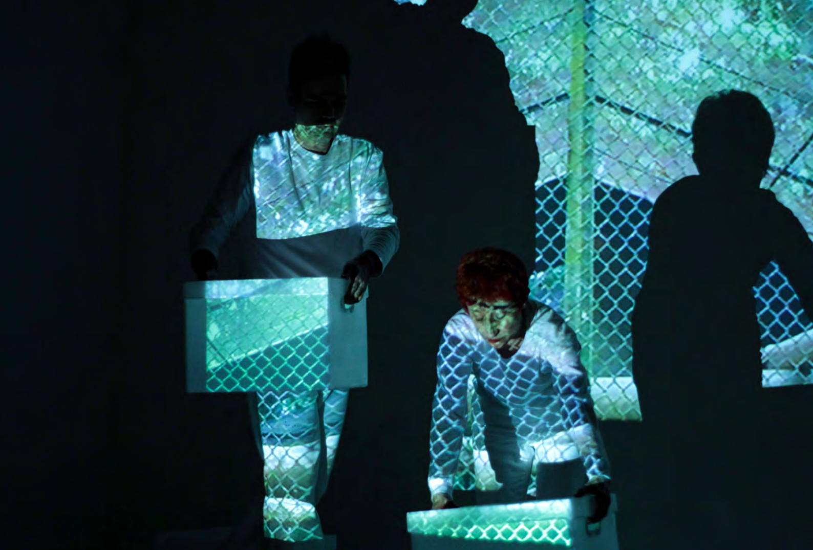
Performance na Videoinstalação ZOO , de Hugo Fortes e Sissi Fonseca Centro Cultural Recoleta, Buenos Aires, 2013.