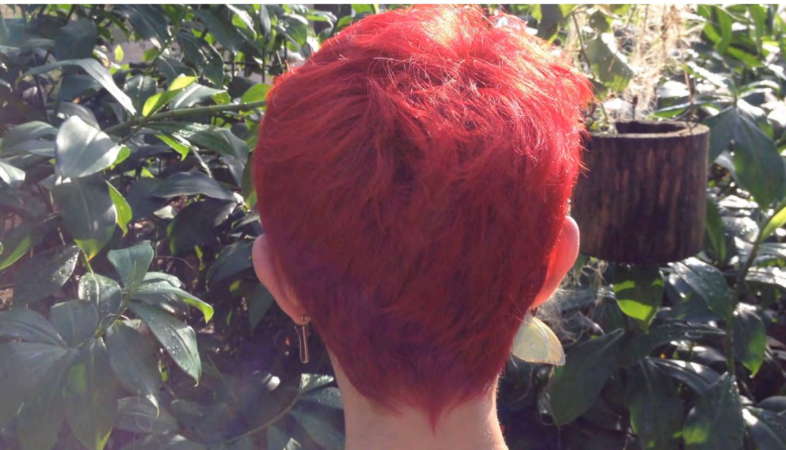
Frame do vídeo ZOO , de Hugo Fortes e Sissi Fonseca, 2013

outros pássaros exóticos, macacos irritados em jaulas, tartarugas, jacarés e animais domésticos em suas atividades cotidianas. São imagens de naturezas distintas, algumas de qualidade fotográfica, outras com uma evidente construção eletrônica. Este estranhamento também é ressaltado pela forma como o vídeo é editado.