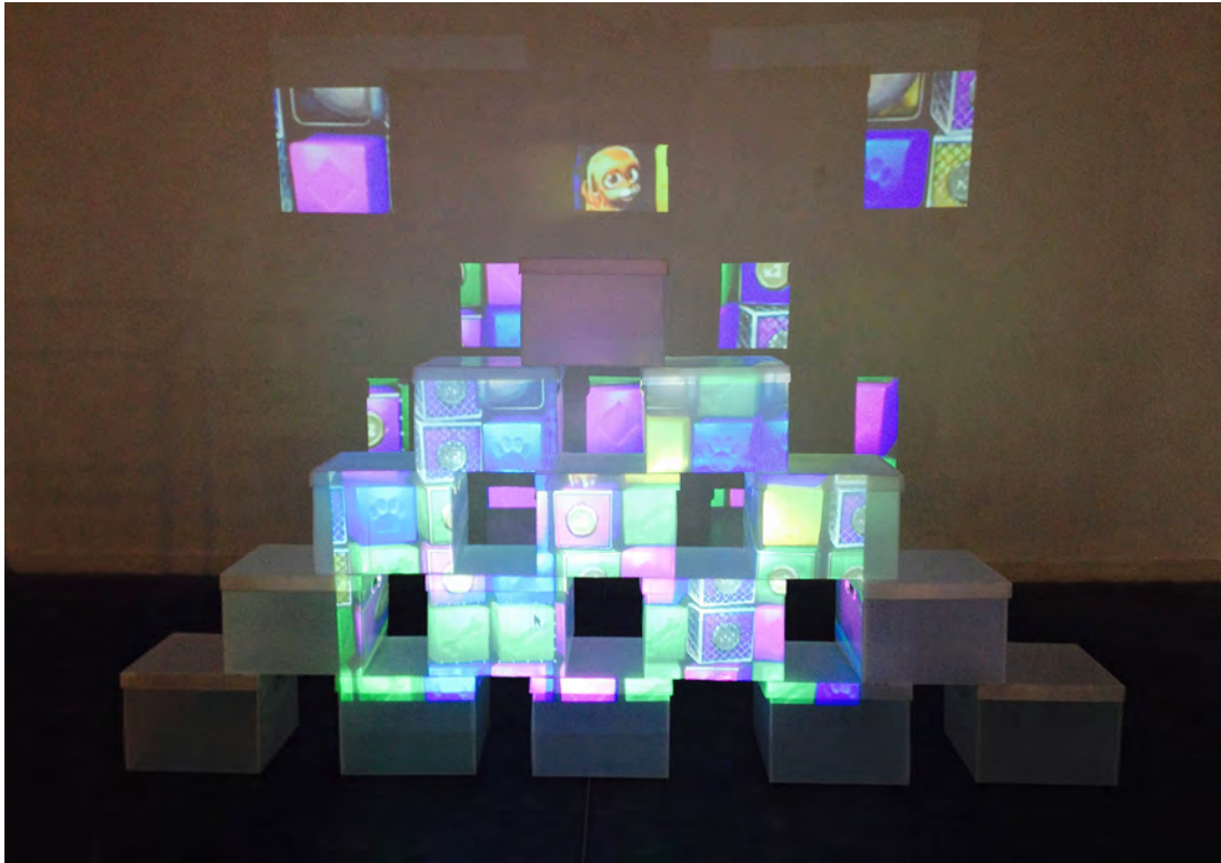
Videoinstalação ZOO , de Hugo Fortes e Sissi Fonseca Centro Cultural Recoleta, Buenos Aires, 2013

das imagens. O trabalho foi apresentado integralmente pela primeira vez no FASE 5.0, festival de arte e tecnologia realizado no Centro Cultural da Recoleta, em Buenos Aires, em 2013. Dependendo do espaço expositivo, o trabalho pode se alterar, bem como a performance pode assumir novas configurações. Acho interessante pensar uma obra de arte que não possui uma única forma fixa de apresentação, mas uma estrutura poética e alguns elementos e procedimentos norteadores, que podem receber diferentes atualizações. A introdução da performance junto a instalações, busca evidenciar o caráter dinâmico da prática artística e acrescenta um conteúdo poético que reforça o caráter de transformação a que esses trabalhos estão sujeitos.