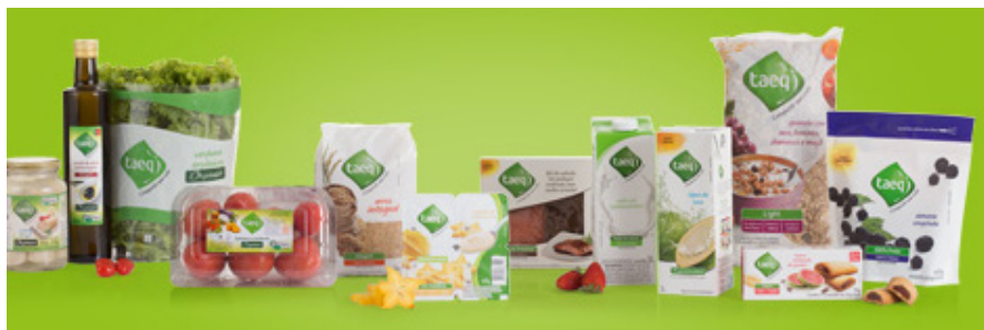
Figura 1: exemplos da linha de produtos Taeq