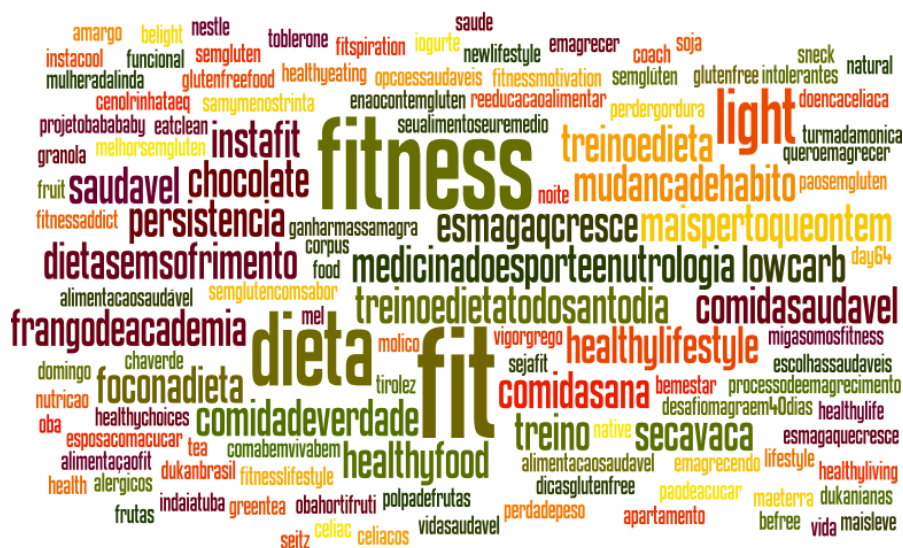
Figura 3: nuvem de palavras com as hashtags que acompanham #taeq nas postagens observadas

Termos como #fitness, #dieta, #fit, #light aparecem com destaque, ao lado de uma infinidade de palavras e expressões que remetem a emagrecimento e academia de ginástica.