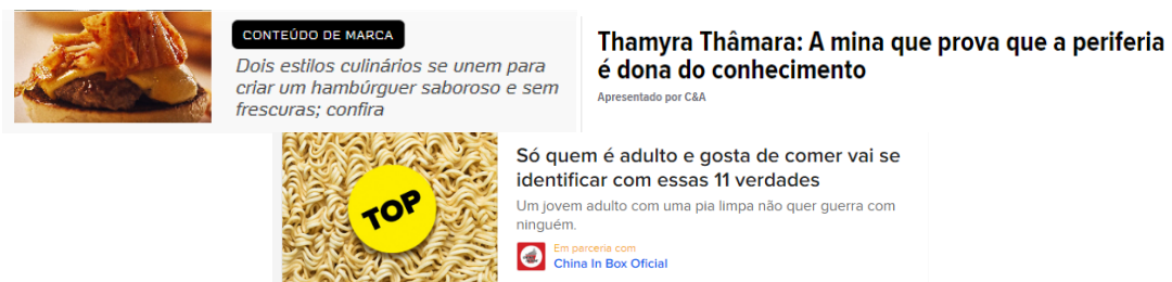
Figura 2 - Formas de identificação nas chamadas de publicidade nativa

Considerando especificamente as chamadas, as tarjas e os textos explicativos parecem ser as soluções mais recorrentes. Nos casos que aparecem em sites de informação e notícia, a única diferença entre as chamadas publicitárias e as chamadas jornalísticas é a presença de uma tarja em algum ponto das fotos, trazendo expressões como “patrocinado”, “conteúdo de marca” ou algo equivalente. Não é raro, todavia, que, em uma linha inferior, como complementação da informação, o nome das empresas ou das marcas anunciantes apareça escrito, com algum atenuante visual: em tamanho reduzido, entre parênteses, na cor cinza etc.