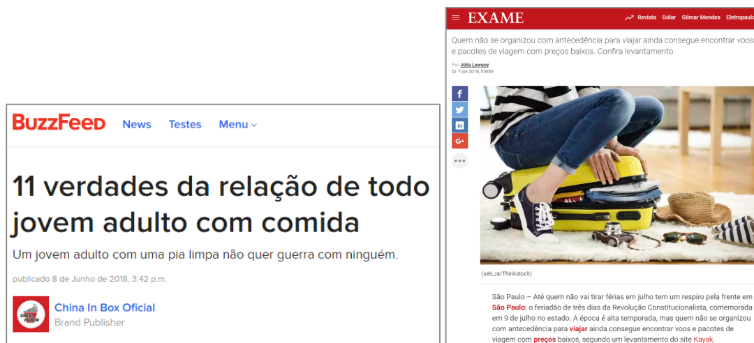
Figura 4 - Publicidade nativa: anunciante explícito (esquerda) e anunciante mimetizado (direita).

conteúdo desenvolvido pela marca, que possui a mesma diagramação das matérias do site que lhe serve de veículo. A presença da marca anunciante é evidenciada seja pelos textos, seja pela sua identidade visual, seja, inclusive, pela presença, na mesma página, de anúncios em formato tradicional. Trata-se da mais simples das possibilidades identificadas, sendo mais evidente nos portais de entretenimento, que naturalmente já possuem uma linguagem mais próxima daquela tradicionalmente encontrada no discurso promocional visual das marcas.