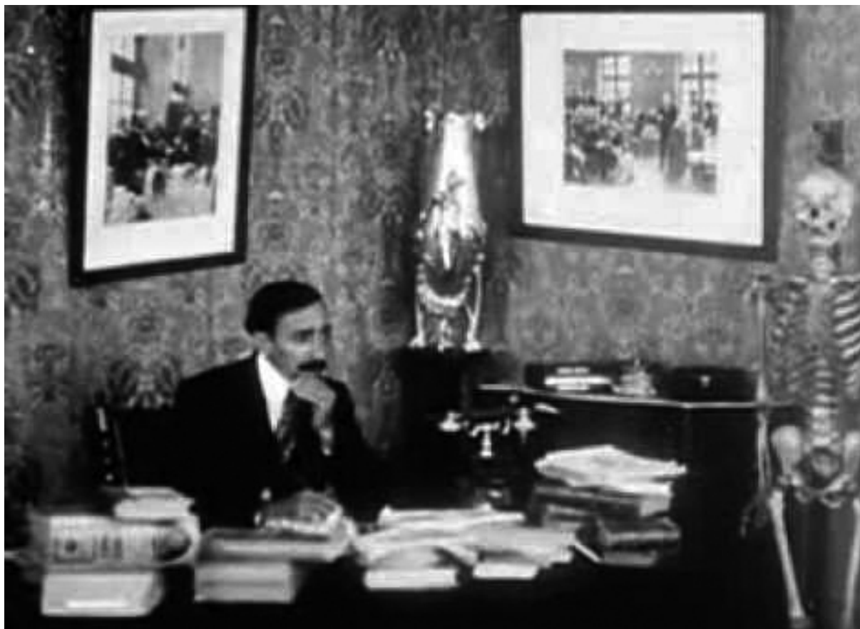
Os óculos do vovô (Francisco Santos, 1913)

O que logo se explicou. Atendendo à solicitação de empréstimo dos fragmentos de Os óculos do vovô feita pela Cinemateca Brasileira, a Embrafilme efetivamente nos enviara “fragmentos” dos fragmentos do filme, que haviam sido utilizados numa antologia, e não a cópia “completa” (a totalidade dos fragmentos). Porém o que me causou estranheza não foi o fato de a cópia estar incompleta, e sim a ausência do plano 22. Se fazia todo o sentido que numa antologia se usasse apenas um trecho do filme, antecedido pelos créditos da restauração, não fazia nenhum supor que deste trecho –ao todo 15 planos, afora a introdução– se tivesse retirado um único, entre os planos 21 e 23.