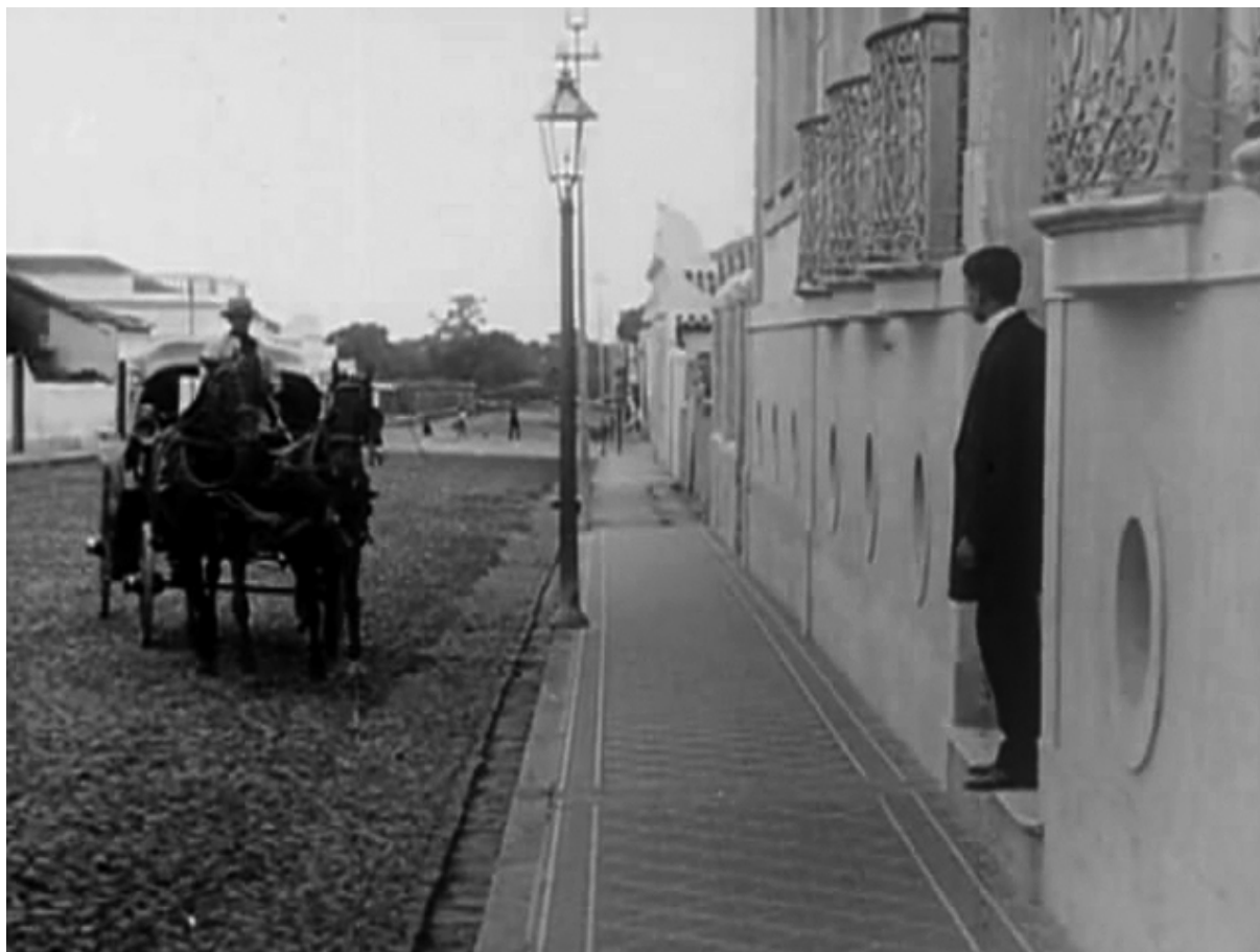
Os óculos do vovô (Francisco Santos, 1913)

Afora algumas fotografias, nada sobrou das dezenas de filmes de enredo feitos no Brasil entre 1908 e 1912 –a chamada “bela época” do cinema brasileiro. Com base nestas fotografias e em poucas descrições de enredos, supunha-se que a estrutura dos filmes brasileiros, até os anos 20, 12 era composta por uma sucessão de quadros de ação completa, interligados por letreiros que deveriam explicar os acontecimentos e estabelecer a concatenação lógica entre eles. 13 Os letreiros instituem o enredo e antecipadamente informam sobre qual é a ação de cada quadro; as imagens não