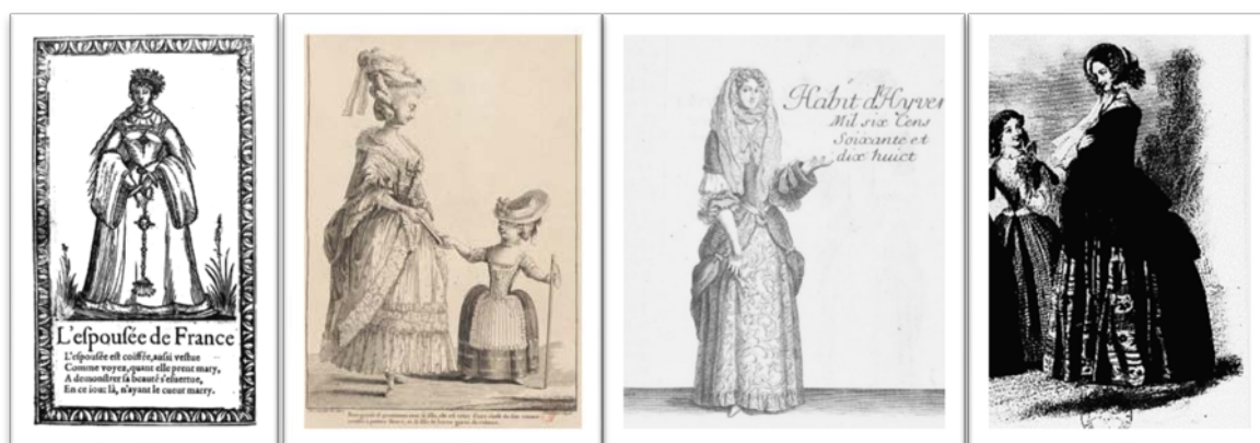
Figura 4: Exemplos de gravuras de publicações que apresentam informações sobre indumentária nos séculos XVIII e XIX.

variações de largura de tecidos. Este manual já apresenta informações sobre proporções e medidas.