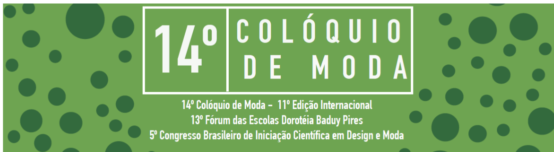
Figura 3: Fotografia de estúdio. Porto Alegre, início do século XX.