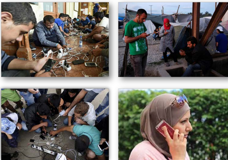
Figura 1 – “Refugiados sírios utilizam a Net nos campos provisórios de acolhimento”

surpreendentes foi o uso dos dispositivos móveis. O relatório do Centro de Pesquisa Pew apresenta a pegada digital dos migrantes, que transportavam um smartphone, entre o Oriente Médio e a Europa 3 , a partir do momento em que saíram das suas casas até à chegada ao país onde pararam ou se queriam estabelecer. O registo dos contactos mostra que os migrantes utilizaram este dispositivo, e as redes sociais, para comunicar com familiares que, muitas vezes, ficaram para trás, mas também para procurar mapas e informações sobre cruzamentos nas fronteiras, ou locais de apoio à sua viagem, como acampamentos, check points e outras. O relatório dá informações precisas sobre a nacionalidade (principalmente nacionais da Síria e Iraque), os movimentos e tempos de permanência nos países que atravessaram (Turquia e Grécia) e sobre a duração da viagem que empreenderam até aos locais de permanência.