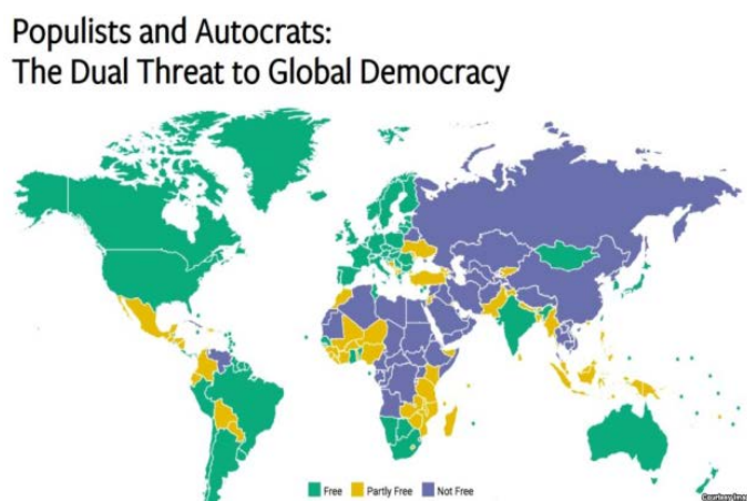
Figura 2 – Freedom House "Ameaças globais à democracia e a liberdade de expressão"

Fonte: Ameaças à Democracia e à liberdade de expressão em 2017 5