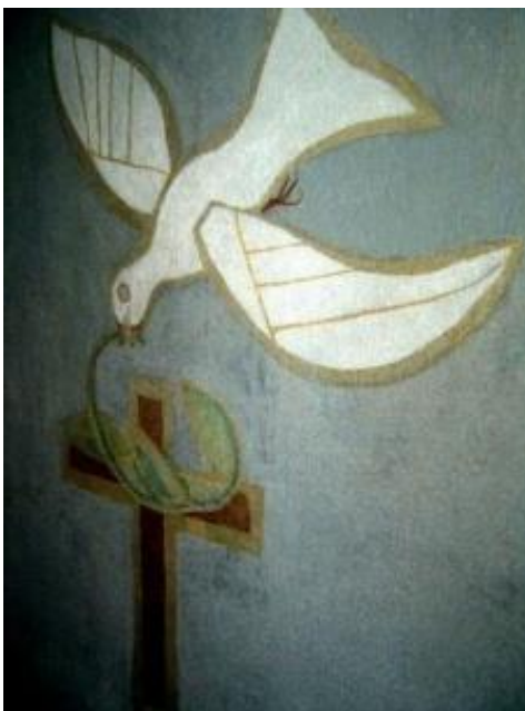
Yolanda Mohalyi (1909 – 1978) Pomba da paz, 1951 Têmpera Mural da Capela do Cristo Operário em São Paulo