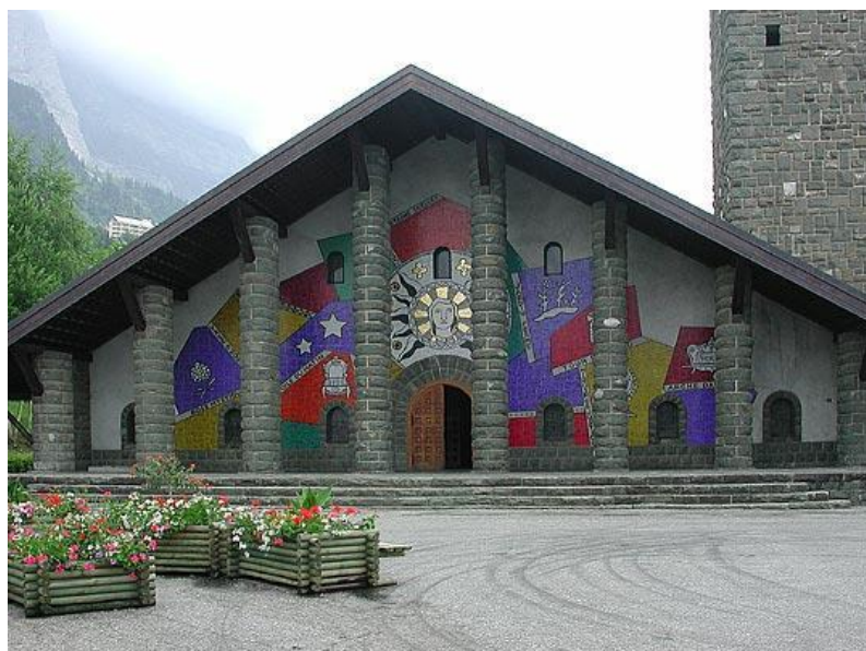
Igreja de Nossa Senhora das Graças Plateau d'Assy, França