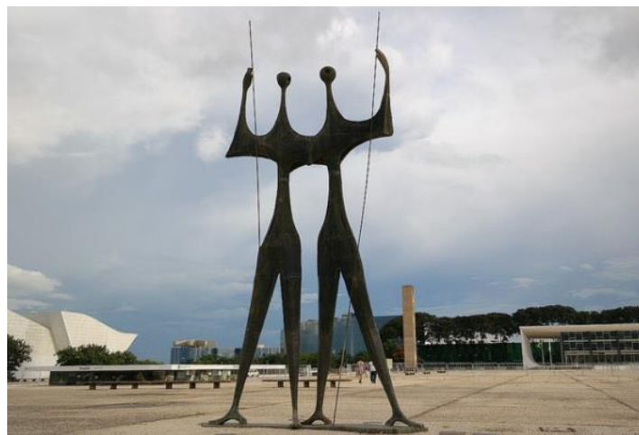
Bruno Giorgi (1905-1993) Os Candangos (ou Os Guerreiros) (1959) Bronze, 8m Brasília, Distrito Federal