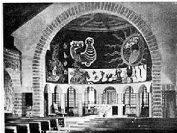
Jean Lurçat (1892 – 1966) O Apocalipse, tapeçaria, 1945 coro, Ig. Notre-Dame-de-Toute-Grâce, Assy, França.