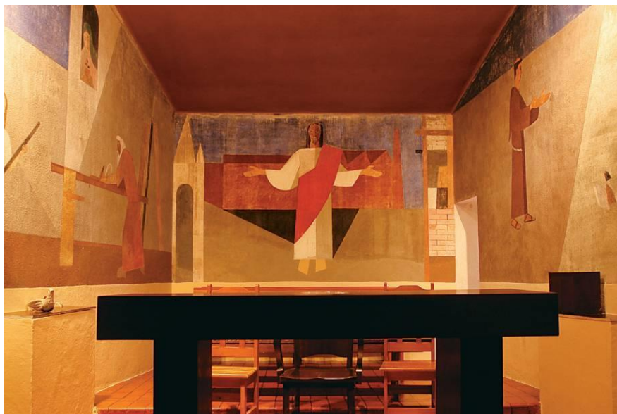
Alfredo Volpi (1896 – 1988) Mural do Cristo Operário, 1951 Igreja Cristo Operário em São Paulo