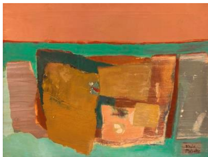
Yolanda Mohalyi (1909 – 1978) Sem título Óleo sobre tela, 90 x 120 cm