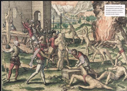
Adalberto Monteiro Lobato. O primeiro brasileiro a chegar ao Brasil, 1923. Ilustração de Gustavo Pimenta.

Entre as versões mais populares figura aquela cujo título encontra-se transcrito nesta página. Escrita em 1923 por — adalberto — Mon- teiro Lobato, o relato foi preterido na trans- formação do livro numa narrativa de aventura com fins educativos. Afinal, na visão do criador de Euclides, apresentava um cenário tão reconheci- to quanto o de Robinson Crusoe, com a vantagem de descobrir os primeiros do Brasil ao leitor