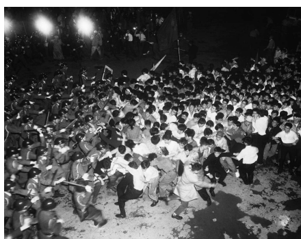
a) Tóquio 1968

em vigor 11 . Antagônicas às formas de poder institucionalizado – de governanças corporativas e estatais monolíticas a partidos políticos e sindicatos burocratizados –, essas manifestações de resistência, centradas principalmente nas universidades e nas fábricas, culminaram na turbulência global de 1968, que atingiu diversas cidades ao redor do mundo, como Chicago, Paris, Praga, Cidade do México, Madri, Tóquio, Berlim... 12