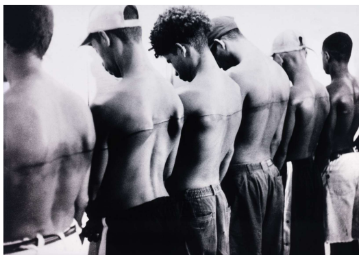
Fig. 7: Santiago Sierra. Documentación de línea de 250 cm tatuada sobre 6 personas remuneradas , 1999.

pecuniário, sendo, muitas vezes, submetidos a situações aviltantes ou constrangedoras por necessidade ou ignorância. Na sociedade “pós-industrial” em que vivemos, todas as obras de arte que usam o corpo alheio, mesmo aquelas com comprometimento ideológico dos participantes, levam a uma reflexão sobre a natureza alienada do trabalho no mundo capitalista. A remuneração paga pelo artista aos corpos utilizados é sempre, muitas vezes, inferior à riqueza gerada pelo trabalho desses corpos, um dilema ético que é sabiamente explorado por Sierra.