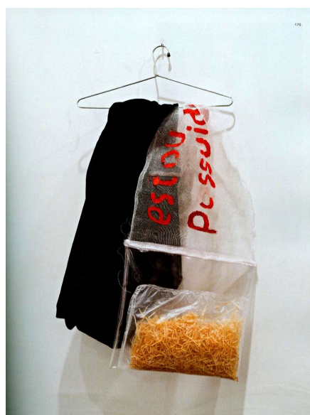
b) Parangolé exposto na Casa França-Brasil, Rio de Janeiro, Exhibition Artevida: Corpo , 2014.