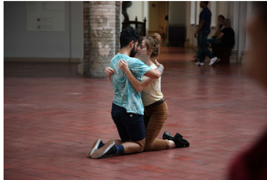
Fig. 8: Tino Sehgal. The Kiss , 2014.

O artista Tino Sehgal (1976) tenta escapar dessa armadilha do mercado de arte de transformar toda a experiência em mercadoria. Para isso, ele elabora uma série de artimanhas: suas peças são coreografias executadas por intérpretes treinados de maneira regular, durante todo o período de suas exposições em museus ou galerias; seus materiais são a voz humana, a linguagem, o movimento e a interação e só existem de maneira efêmera, só podendo ser documentadas na memória do observador.