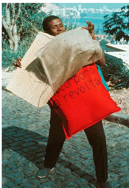
a) P15 Parangolé Capa 12, Eu incorporo a revolta , 1967.

da escola de samba Estação Primeira da Mangueira. O contato com a comunidade do Morro da Mangueira estimulou Oiticica a produzir a partir da experiência com a dança, dos ritmos dionisíacos do samba e das relações organizadas em torno da criação coletiva. Como título de sua nova proposição, Oiticica se apropriou da identificação de um abrigo improvisado, construído por um morador na rua, na qual se lia “Aqui é o Parangolé”. Para o artista, o Parangolé era a “totalidade-obra” que só existiria plenamente quando alguém a utilizasse e que só pelo movimento suas estruturas se revelariam.