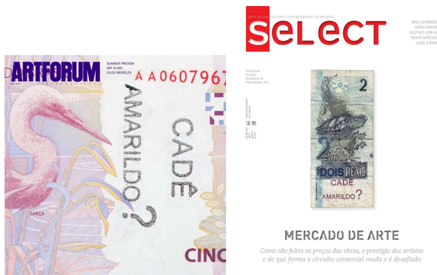
a) Projeto cédula na capa da revista Select , novembro de 2013. b) E na capa da revista Arforum , maio de 2014