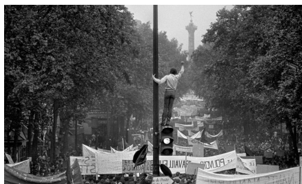
c) Paris 1968