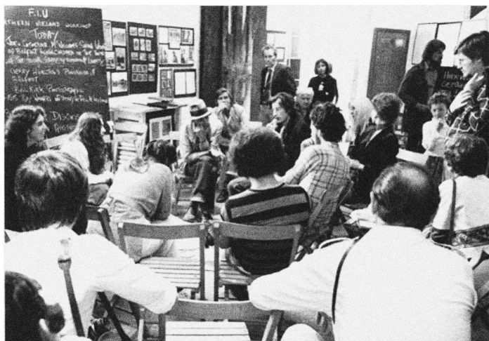
Fig. 1: Joseph Beuys. Espaço de oficinas da FIU durante Documenta 6, Kassel, 1977.

isonomia política e da democratização do ensino 5 , pontos que ainda estão sendo reivindicados pelos estudantes brasileiros nas diversas ocupações das escolas e universidades do país, durante os últimos anos.