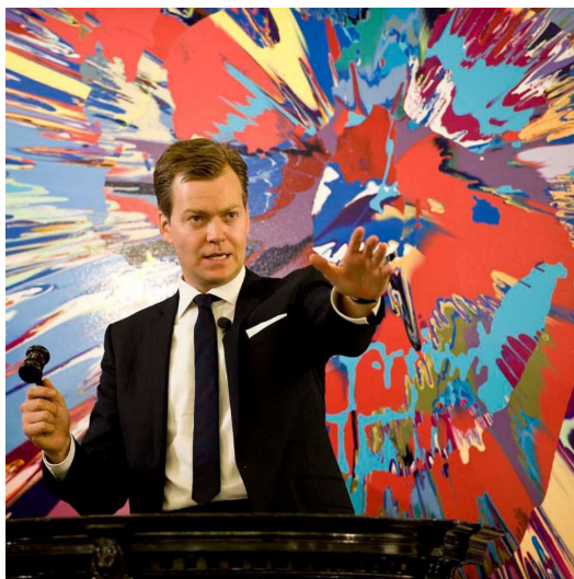
Fig. 8: Damien Hirst. Beautiful Inside my Head , 2008.

Surgem os “jovens-artistas-mercadoria” que abastecem a demanda capitalista pelo “novo-sempre-igual” 18 .