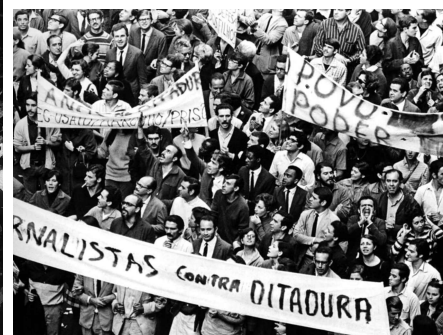
b) Rio de Janeiro, 1968