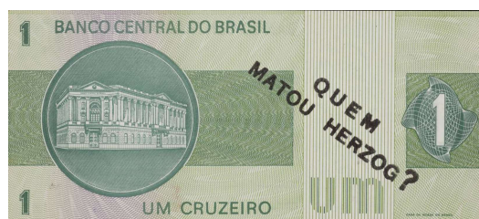
Fig. 5: Cildo Meireles Projeto Cédula , 1970-1976.

Outro exemplo da apropriação da subversão pode ser vista na atualização do Projeto Cédula do artista Cildo Meireles. Em 1970, em plena ditadura militar, Cildo realizou as chamadas Inserções em circuitos ideológicos , que consistiam de objetos como vasilhames de coca-cola e notas de dinheiro com frases como “Yankees go home”, ou “Quem matou Herzog?” (jornalista morto na cadeia durante o regime militar). Numa declaração de 1981 15 , Cildo comenta que: