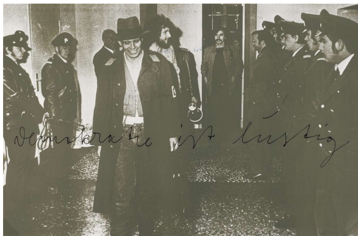
Fig. 2: Joseph Beuys. Demokratie ist lustig , 1973.

de suas articulações com as instituições do poder, sejam elas o Estado – que estabelece o que é digno de se tornar cultura nacional – a mídia –, que decide o que é verdade, o que é pós-verdade e o que não é nenhuma das duas – e o poder econômico privado ou corporativo, representado pelos colecionadores, investidores e instituições – que decidem quem integra as grandes coleções e exposições. Articulações inevitáveis, já que a arte, pelo menos desde a Idade Média, mantém relações cordiais com o poder – incorporado primeiro pela igreja, depois pela aristocracia, pela burguesia e, mais recentemente, pelas corporações.