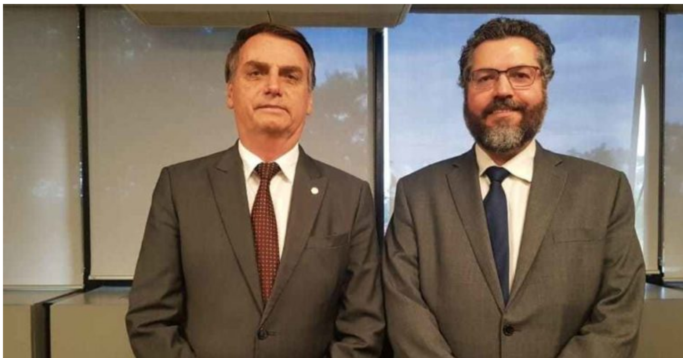
Ernesto Araújo (à direita) com o presidente brasileiro Jair Bolsonaro. Párias dos direitos humanos