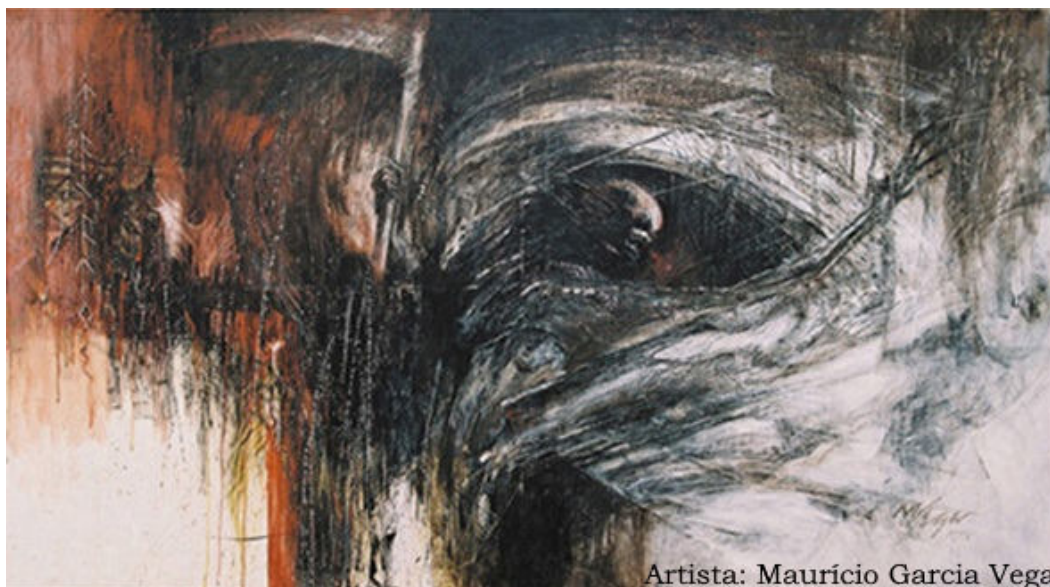
Artista: Maurício Garcia Vega

Tanatos, a figuração da morte na mitologia grega