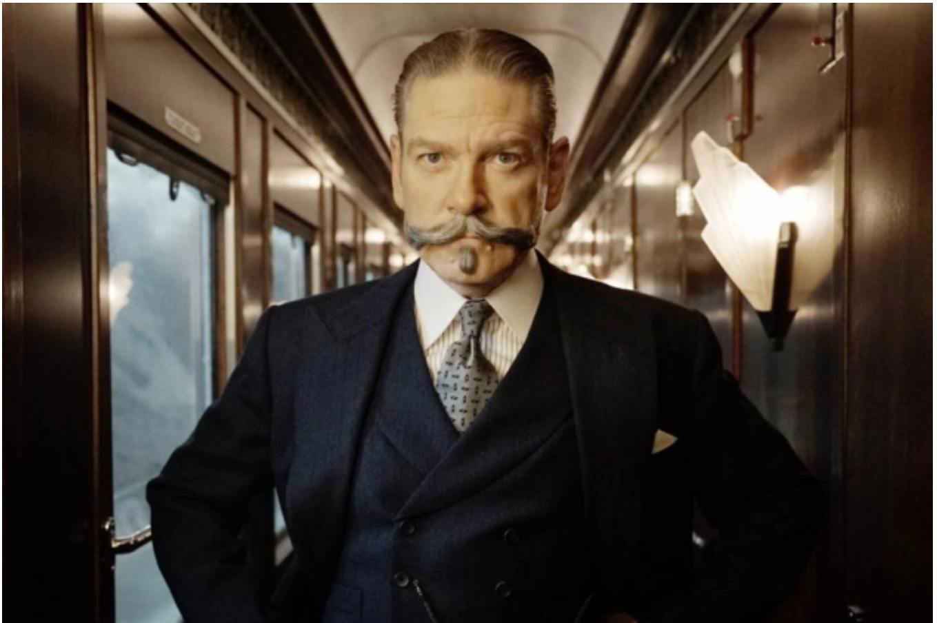
Kenneth Branagh interpreta o detetive Hercule Poirot pela segunda vez em Morte no Nilo (2022).