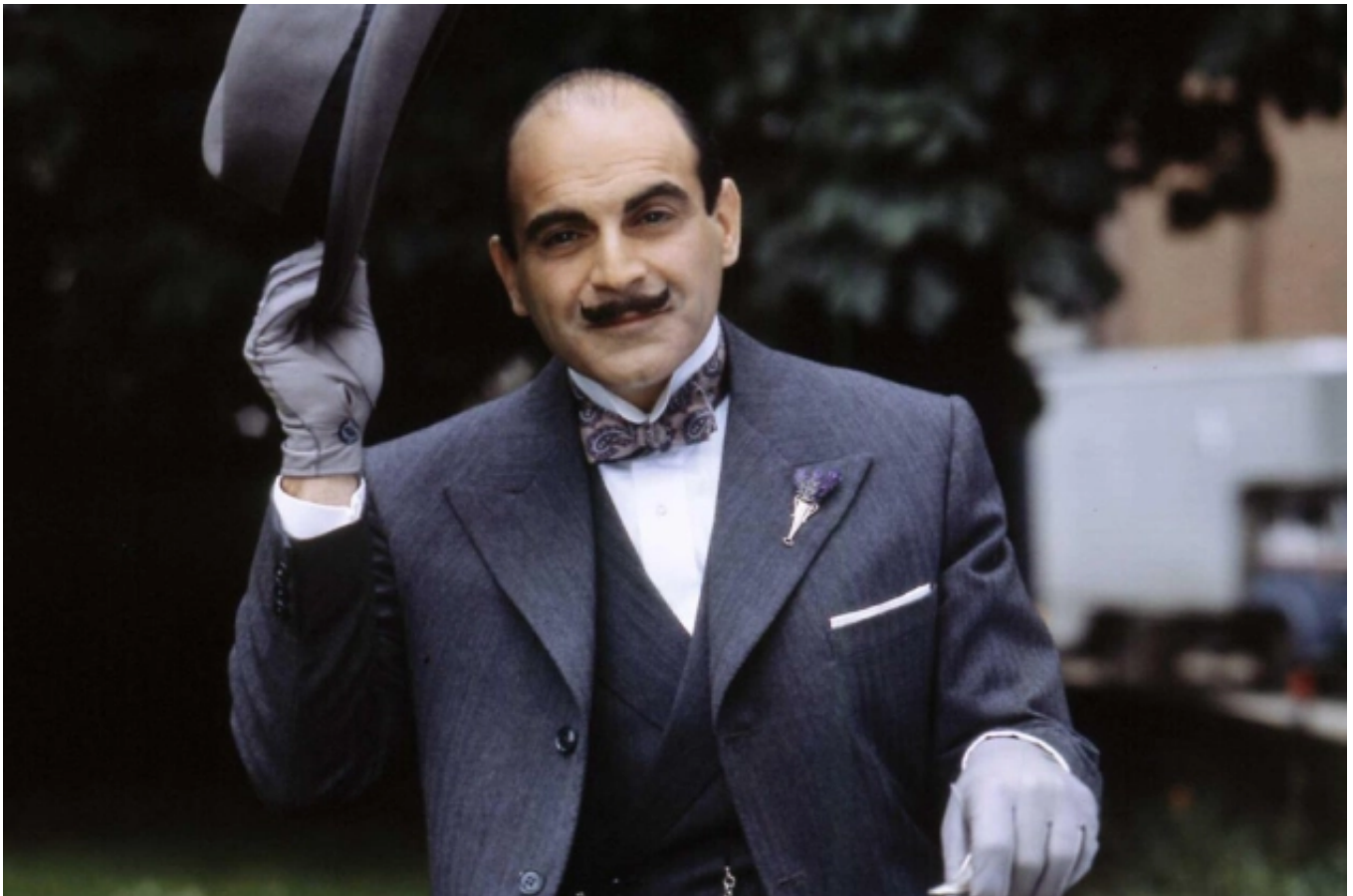
David Suchet interpretou Hercule Poirot por 24 anos em adaptação inglesa para TV.

Mas o Poirot mais famoso foi feito pelo ator David Suchet , que interpretou o detetive por 24 anos na série de TV Agatha Christie's Poirot , produção do canal inglês ITV que foi ao ar de 1989 até 2013.