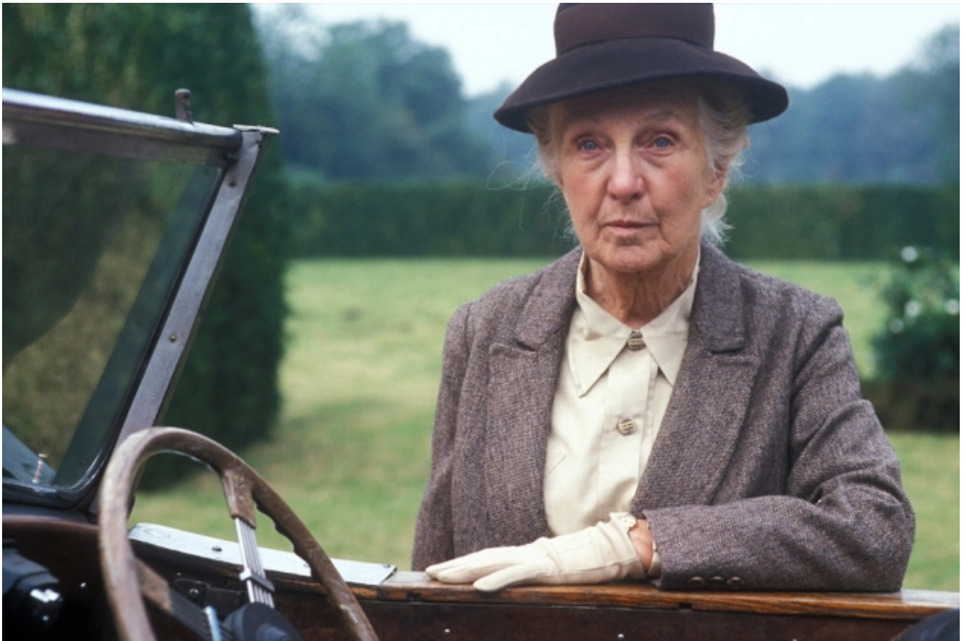
Joan Hickson fez uma das representações mais conhecidas de Miss Marple.