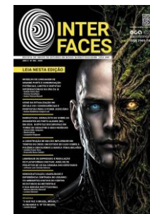
Interfaces da Comunicação