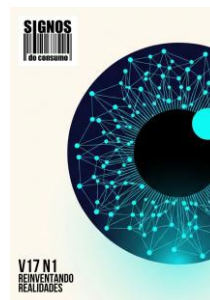
Signos do Consumo