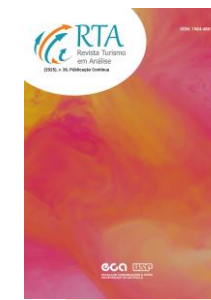
Revista Turismo em Análise RTA